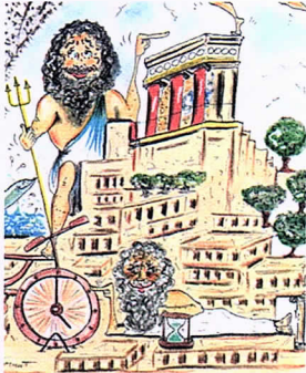
LORELLA FERMO, NELLA TERRA DEL MITO (particolare) , cm 21 x 15, tecnica mista su carta, 2017

centro propulsivo di pensieri e azioni che si snodano nelle attività di ricerca archeologica, alla scoperta di una civiltà che ha preceduto quella ellenica vera e propria e che ha ancora ampi margini di mistero per gli studiosi. Il recupero memoriale è il primo tema che si pone all'attenzione di chi legge.